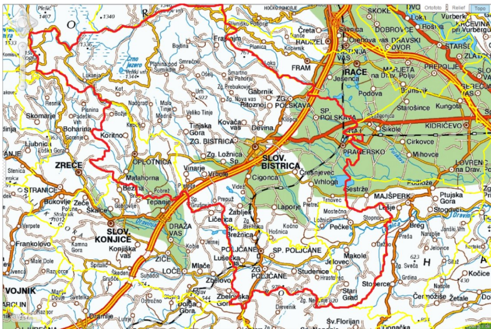
Slika 7-1: Prikaz območja izvajanja storitev ZD Slovenska Bistrica

Svojo dejavnost ZD Slovenska Bistrica izvaja na območju občin ustanoviteljic, to so poleg občine Slovenska Bistrica še občine Makole, Poljčane in Oplotnica. Območje delovanja obsega okoli 367 km 2 površine.