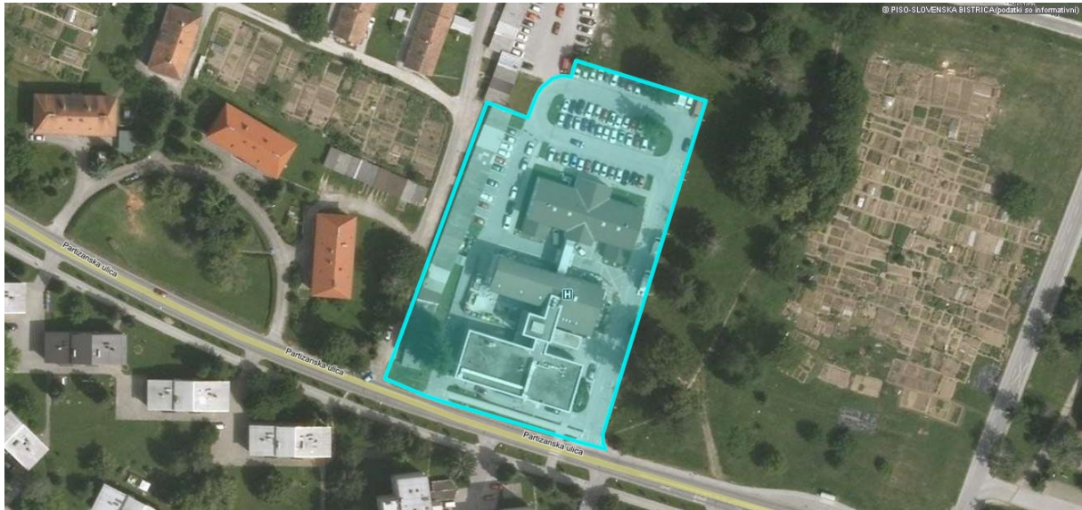
Slika 7-2: Mikrolokacija Zdravstvenega doma Slovenska Bistrica